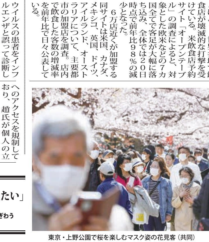
東京・上野公園で桜を楽しむマスク姿の花見客

【ニューヨーク共同】新型コロナウイルスの感染拡大を受けた営業制限などにより、世界各地で飲食店が壊滅的な打撃を受けている。米飲食店予約サイト「オープンテーブル」の調査によると、対象とした欧米などの7カ国全てで客数が大幅に落ち込み、全体では20日時点で前年比98%の減少となった。 6万店近くが加盟する同サイトは米国、カナダ、メキシコ、英国、ドイツ、アイルランド、オーストラリアについて、主要都市の加盟店を調査。店内で飲食した客数の増減率を前年比で日々公表している。