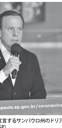
非常事態を宣言するサンパウロ州のドリア知事 (GOVESP)

マンデッタ保健相は、22日、新型コロナウイルスの感染拡大を抑制するための外出制限などに伴う勤務形態の変化とともに、解雇などが起きるのを避けるため、連邦政府が提唱していた対策に、ボウソナ大統領が22日に暫定令(MP)を出したが、その中に、「雇用主は4カ月以内の労働契約を停止し、雇用者への給与支払いを止めても良い」との規定があり、物議を醸した。大統領は、聖州などがはじめた新型コロナウイルス対策の非常事態宣言などにも苦言を呈しており、政界内に大きな波紋を投げかけている。23日付ボウソナサイトが報じている。