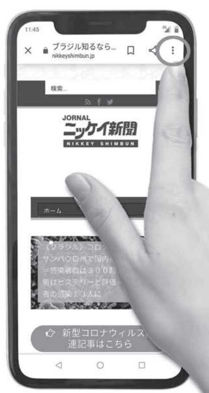
ホーム画面に追加

【共同】安倍晋三首相は23日の新型コロナウイルス感染症対策本部会合で、日本人を含む米国からの入国者に対し、検査所長が指定する場所での14日間の待機や、国内での公共交通機関の使用を自粛を要請した。事実上の入国制限措置。26日午前0時から運用を開始。当面は4月末まで実施する。今回の入国制限は、日米間の交通停滞に加え、日米間の経済活動への影響を懸念し、経済への影響を軽減するため、日米間の経済活動に影響を及ぼすことなく、国内の経済活動を維持する。政府は、入国者に自宅やホテルなどで待機してもらい、発熱や呼吸器症状などの症状が出た場合は、検疫所や指定された医療機関に搬送される。政府は、入国制限の理由として「米国でも全土で感染者が3万人を超えている」と説明。今後の対応では「諸外国の感染状況を分析し、機動的な水際対策を打ち出す必要がある」と述べ、必要に応じて米国を含む関係国への入国制限を厳格化する考えを示唆した。