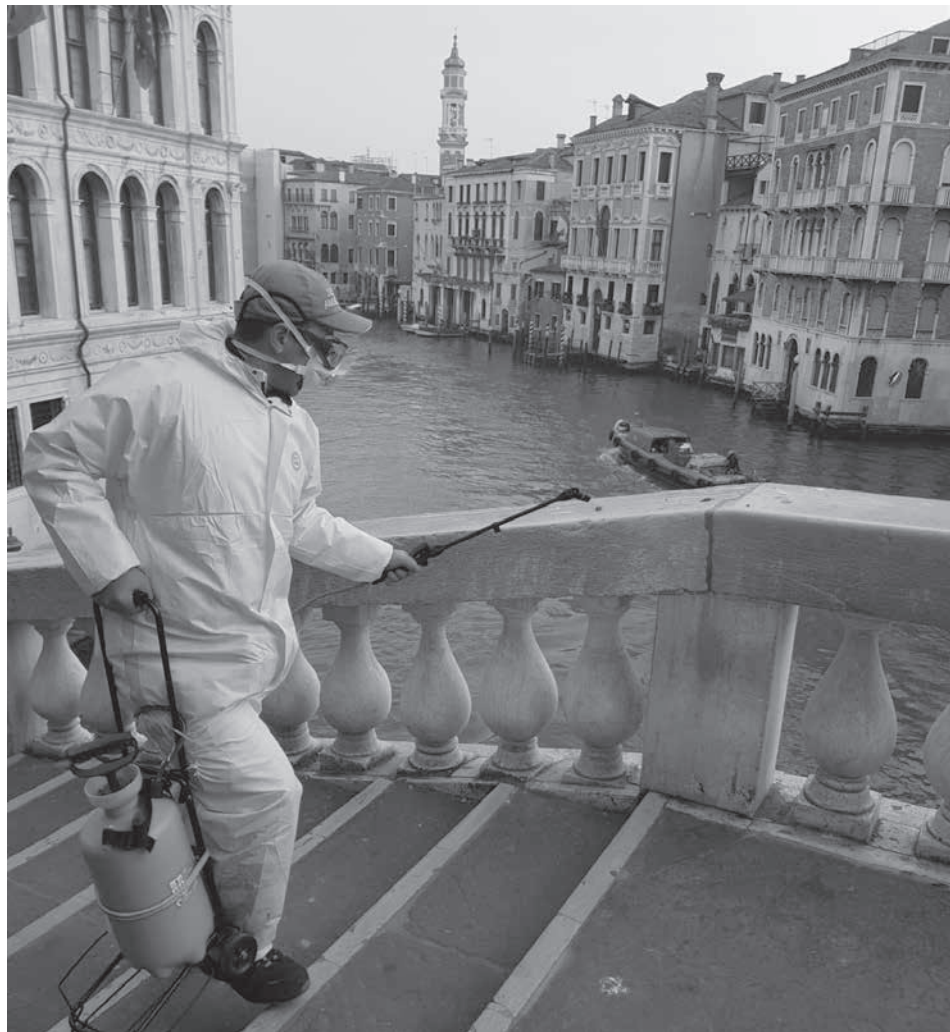
観光客が皆無になったイタリアの古都ヴェネツィアを消毒して回る職員。いずれサンパウロでも見られそうな光景 (3月11日、Comune di Venezia)

「今のイタリアは、3週間後のサンパウロかもじゃない」――まるで世紀末に向かって黙示録のページを一枚一枚めくるように、ブラジルのコロナ危機は毎日悪化の途を歩んでいっている。冒頭に掲げた予測はあまりに悲しいが、現実にならないようにするには、今現在、素早い決断と実行が必要だ。どれだけの被害が身の回りに及ぶか想像もできない。読者の皆さんにはぜひ「4月から医療崩壊する」と保健大臣が予告した予測を重くしてほしい。