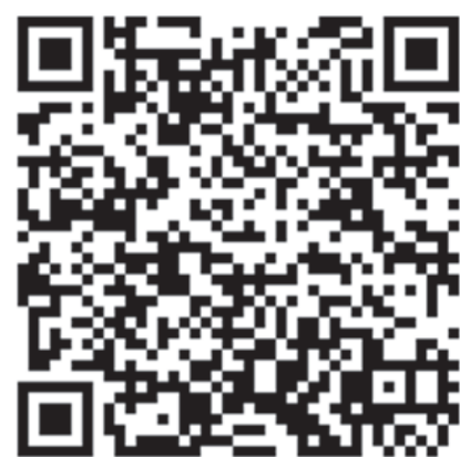
QRコードを読み取るとスマホ用サイト (https://www.nikkeishimbun.jp/)へとぶ