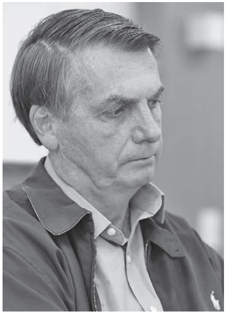
22日のボウソナ大統領

【既報関連】新型コロナウイルスの感染拡大によって経済活動が落ち込んでいる中、感染拡大を抑制するための外出制限などに伴う勤務形態の変化とともに、解雇などが起きるのを避けるため、連邦政府が提唱していた対策に、ボウソナ大統領が22日に暫定令(MP)を出したが、その中に、「雇用主は4カ月以内の労働契約を停止し、雇用者への給与支払いを止めても良い」との規定があり、物議を醸した。大統領は、聖州などがはじめた新型コロナウイルス対策の非常事態宣言などにも苦言を呈しており、政界内に大きな波紋を投げかけている。23日付ボウソナサイトが報じている。